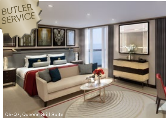
Q5-Q7, Queens Grill Suite

Q5 Q6 Q7 Queens Suite (ca. 47 m 2 ) King-Size-Bett, das in zwei getrennte Betten umgewandelt werden kann. Ankleidebereich. Wohnbereich. Barbereich. Marmorbad mit Badewanne mit Whirlpool-Vorrichtung und integrierter Dusche. Grosser Balkon.