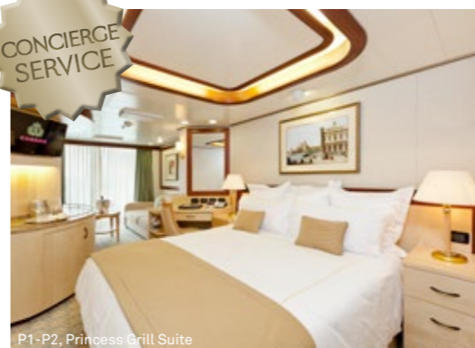
P1-P2, Princess Grill Suite