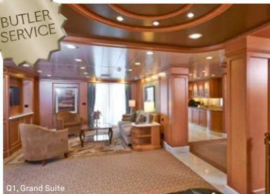
Q1, Grand Suite