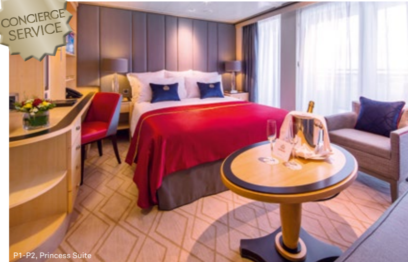
P1-P2, Princess Suite

P1 P2 Princess Suite (ca. 35 m 2 ) King-Size-Bett, das in zwei getrennte Betten umgewandelt werden kann. Wohnbereich. Bad mit Badewanne und integrierter Dusche. Grosser Balkon.