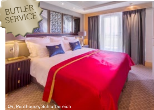
Q4, Penthouse, Schlafbereich