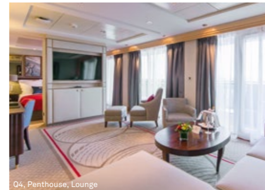
Q4, Penthouse, Lounge