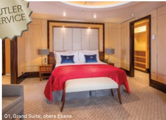
Q1, Grand Suite, obere Ebene