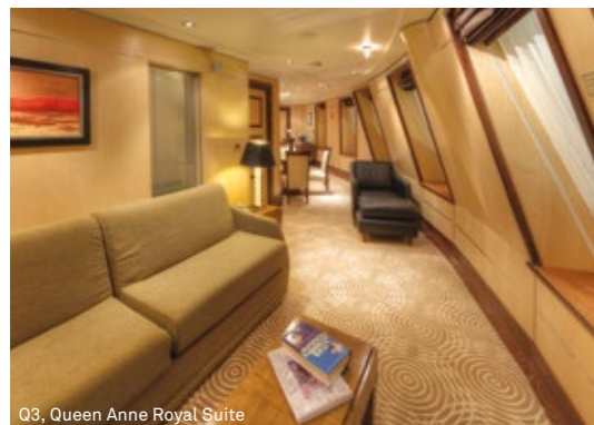
Q3, Queen Anne Royal Suite

Q3 Royal Suite, Queen Anne (ca. 74 m 2 ) Kombinierter Wohn-/Essbereich. Gästebad. Zweiter Wohnbereich. Barbereich. Schlafbereich mit King-Size-Bett, das in zwei getrennte Betten umgewandelt werden kann. Hauptbad mit zwei Waschbecken, Badewanne mit Whirlpool-Vorrichtung und separater Dusche. Suiten verfügen über keinen Balkon, sind jedoch direkt im Bug gelegen und verfügen daher über einen fantastischen Ausblick.